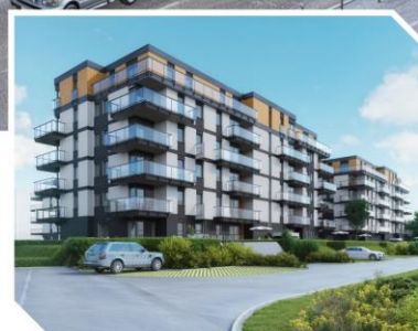
Pomorska Park, Łódź