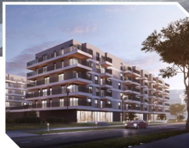
ATAL Marina III, Warszawa