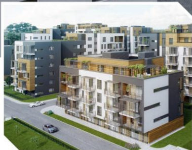
ATAL Francuska Park III, Katowice