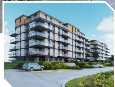
Pomorska Park, Łódź