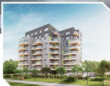
ATAL Marina IV, Warszawa