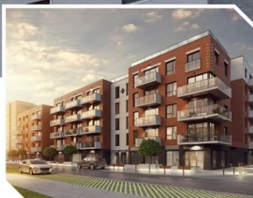
Nowa Grobla Apartamenty, Gdańsk