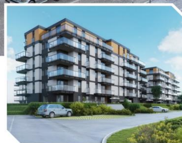
Pomorska Park, Łódź