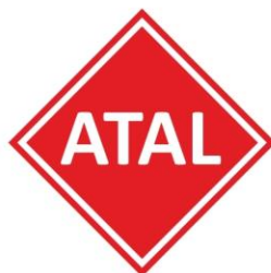
ATAL Residence, Kraków