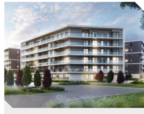
Nowe Miasto Różanka, Wrocław

Jesteśmy otwarci na udzielenie odpowiedzi na wszelkie pytania w dogodnej dla Państwa formie: mailowo, telefonicznie lub w trakcie indywidualnych spotkań. W przypadku zainteresowania pytaniem prosimy kierować na adres: ri@atal.pl