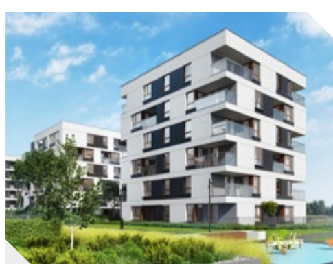
Nowy Targówek IIIA, Warszawa