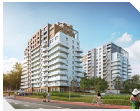
ATAL Balfica Towers, Gdańsk