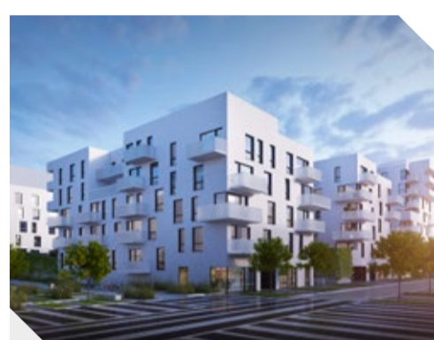
ATAL Nowe Żemiki II, Wrocław