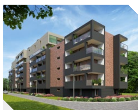
Zbożowa 2A Apartamenty, Kraków