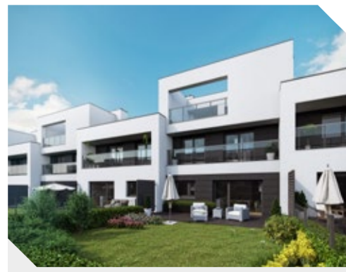
Chojny Park III, Łódź