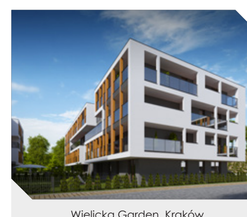
Wielicka Garden, Kraków