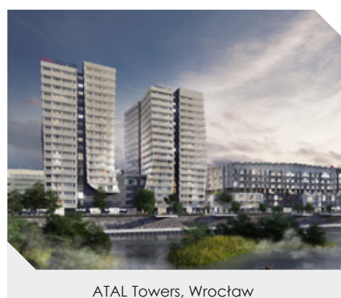
ATAL Towers, Wrocław

W październiku 2016 roku ATAL wypłacił dywidendę w wysokości 0,61 zł na akcję, co łącznie daje kwotę 23,6 mln zł. Dywidenda wyniosła 50% skonsolidowanego zysku netto Grupy z 2015 roku. Nowa polityka dywidendy – Zarząd ATAL rekomenduje WZA zwiększenie dywidendy za 2016 rok do 70% wypracowanego skonsolidowanego zysku netto , przypisanego akcjonariuszom jednostki dominującej. Ponadto w kolejnych latach dywidenda ma wynosić między 70% a 100% skonsolidowanego zysku netto za dany rok obrotowy , przypisanego akcjonariuszom jednostki dominującej.