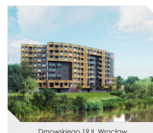
Dmowskiego 19 II, Wrocław

ATAL w 2016 roku przekazał 1404 lokale , przed rokiem było to 628. Oznacza to wzrost o 123,6% rok do roku. Najwięcej przekazania miało miejsce w Krakowie, Warszawie oraz Wrocławiu.