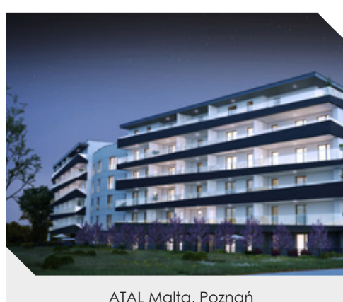
ATAL Malta, Poznań