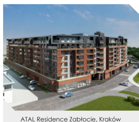
ATAL Residence Zabłocie, Kraków