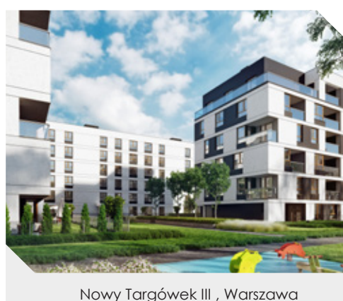
Nowy Targówek III, Warszawa