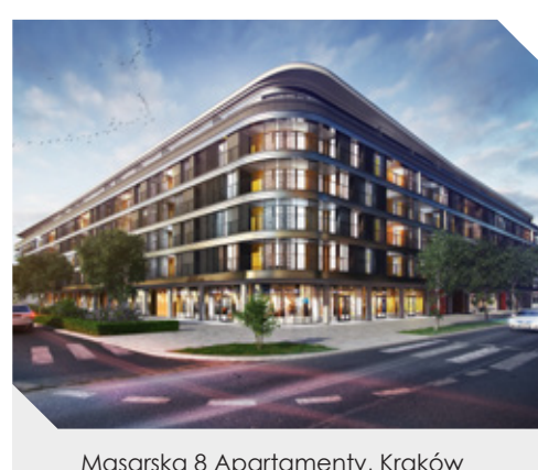
Masarska 8 Apartamenty, Kraków

ATAL, zgodnie z zapowiadaną ekspansją, rozszerzył działalność o rynek trójmiejski i poznański. W drugiej połowie sierpnia 2016 r. do oferty został wprowadzony projekt Nowa Grobla Apartamenty w Śródmieściu Gdańska. Z początkiem października w sprzedaży znalazła się pierwsza inwestycja spółki w Poznaniu – ATAL Malta. ATAL jest jedynym deweloperem obecnym we wszystkich największych aglomeracjach w Polsce. To z kolei pozwala na dalsze zwiększanie sprzedaży, a także na większą niezależność od zmienności koniunktury na poszczególnych rynkach.