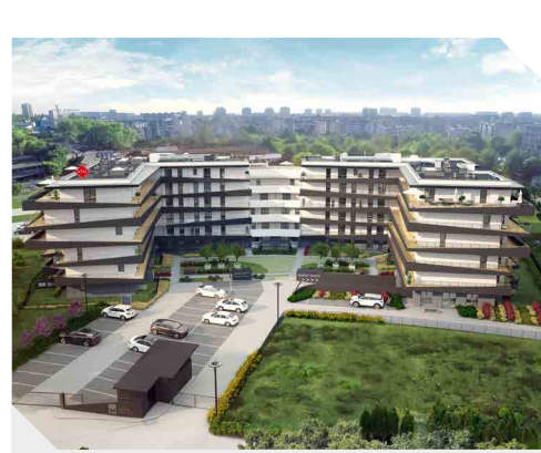
ATAL Malta, Poznań