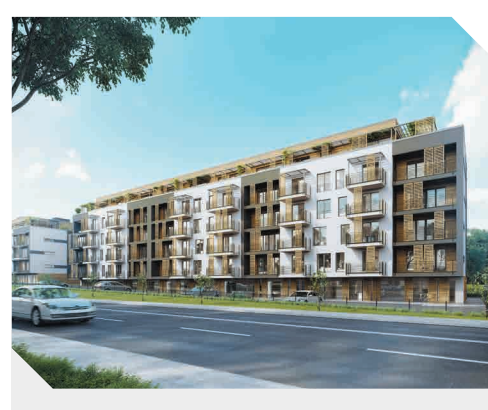
ATAL Francuska Park IV, Katowice