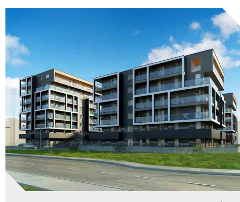
Aparamenty Przybyszewskiego 64, Kraków

ATAL S.A. narastająco po trzech kwartałach 2016 roku osiągnął 450,5 mln zł skonsolidowanych przychodów , czyli o 147% więcej niż przed rokiem. ATAL od stycznia do września br. wypracował 89,8 mln zł zysku netto , czyli niemal 3 razy więcej niż w tym samym okresie poprzedniego roku . Zysk brutto wyniósł zaś 105,5 mln zł – wzrost o ponad 200% rdr . Wskaźnik rentowności brutto osiągnął poziom 23,4%, a rentowności netto 20%.