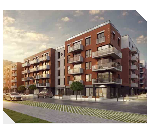
Nowa Grobla Apartamenty, Gdańsk

ATAL, zgodnie z zapowiadaną ekspansją, rozszerzył działalność o rynek trójmiejski i poznański . W drugiej połowie sierpnia br. do oferty został wprowadzony projekt Nowa Grobla Apartamenty w Śródmieściu Gdańska. Z początkiem października w sprzedaży znalazła się pierwsza inwestycja spółki w Poznaniu – ATAL Malta. ATAL jest jedynym deweloperem obecnym we wszystkich największych aglomeracjach w Polsce. To z kolei pozwala na dalsze zwiększanie sprzedaży, a także na większą niezależność od zmienności koniunktury na poszczególnych rynkach.