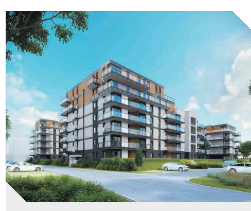
Pomorska Park, Łódź