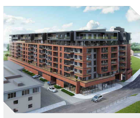
ATAL Residence Zabłocie, Kraków