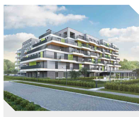
ATAL Marina Apartamenty IV, Warszawa