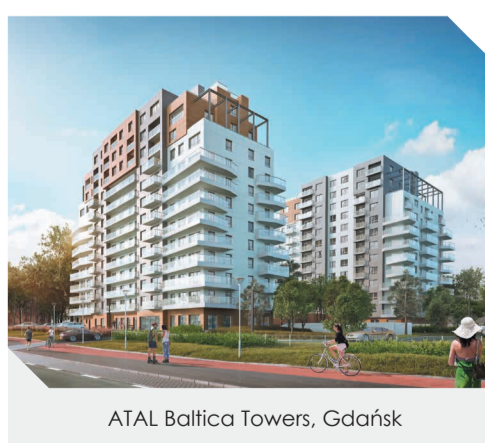
ATAL Baltica Towers, Gdańsk