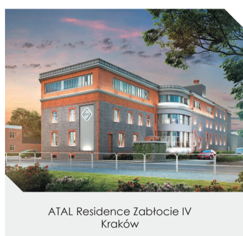
ATL Residence Zabłocie IV Kraków