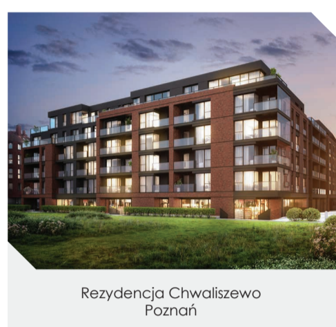
Rezydencja Chwaliszewo Poznań