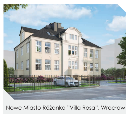
Nowe Miasto Różanka "Villa Rosa", Wrocław

Jesteśmy otwarci na udzielenie odpowiedzi na wszelkie pytania w dogodnej dla Państwa formie: mailowo, telefonicznie lub w trakcie indywidualnych spotkań. W przypadku zainteresowania pytaniem prosimy kierować na adres: ri@atal.pl