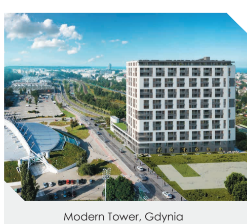
Modern Tower, Gdynia