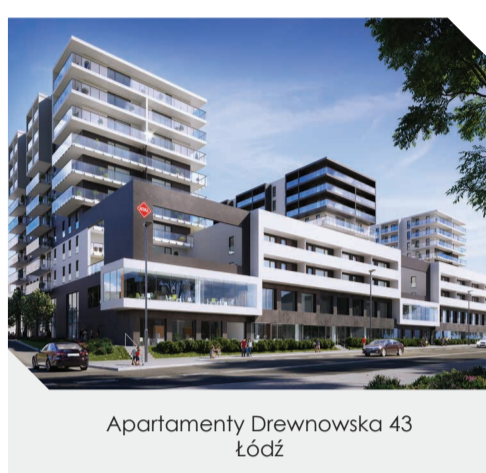
Apartamenty Drewnowska 43 Łódź