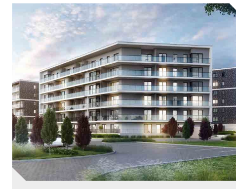
Nowe Miasto Różanka, Wrocław

Jesteśmy otwarci na udzielenie odpowiedzi na wszelkie pytania w dogodnej dla Państwa formie: mailowo, telefonicznie lub w prasie indywidualnych spotkań. W przypadku zainteresowania pytaniem prosimy kierować na adres: ri@atal.pl