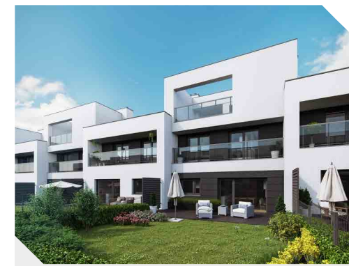
Chojny Park III, Łódź

Na koniec marca 2017 r. ATAL w ofercie posiadał 2461 lokali w siedmiu miastach, gdzie prowadzi działalność, tj.: w Krakowie, Warszawie, Wrocławiu, Łodzi, Katowicach, Trójmieście i Poznaniu.