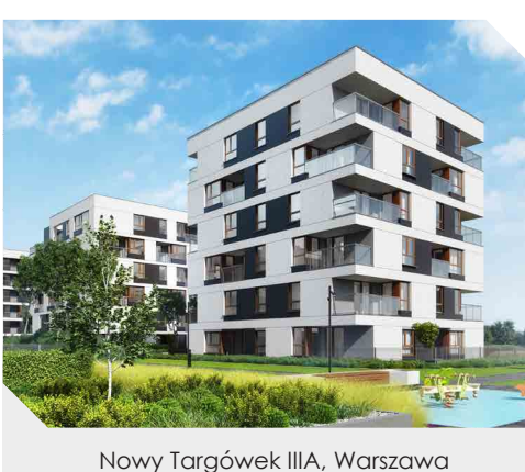
Nowy Targówek IIIA, Warszawa