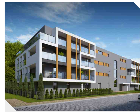
Wielicka Garden II, Kraków