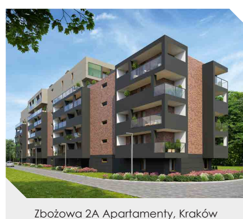
Zbożowa 2A Apartamenty, Kraków