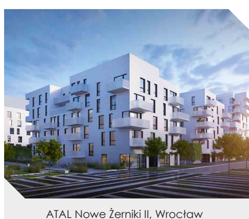
ATAL Nowe Żerniki II, Wrocław