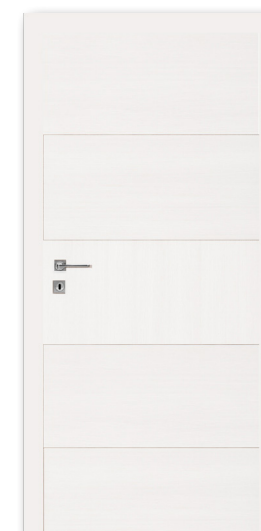
DRE Finea 40