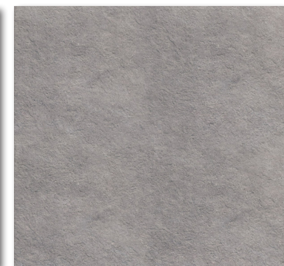
Opoczno Dry River Grey